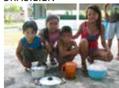
Kärlekens Hem, Manacapuru