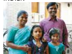
Grace Foundation, New Dehli