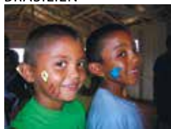
Ray of Hope, Manaus