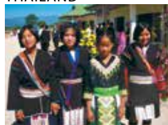
BaanChivitMai – ChiangRai