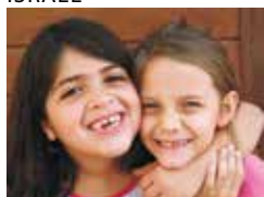
The Jaffa Institute, Tel Aviv