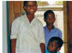
Hope for the Children, Tema