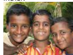
Love & Grace Mission, Coimbatore