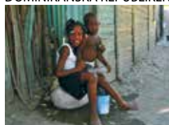
Projecto 4, Azua