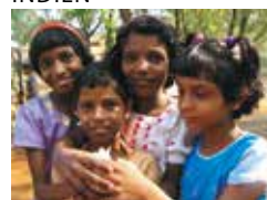
Agape Child Centre, Perumbavoor