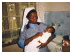
Rangala Baby Home, Ugunja