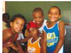
Instituto Evangélico, Japeri