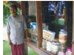
Good Hope Blind Mission, Kottayam