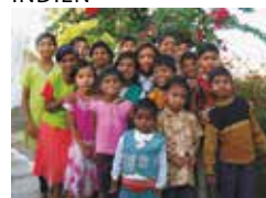
Emanuel Ebenezer Home, Shahpur