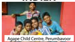
Agape Child Centre, Perumbavoor