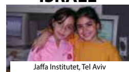
Jaffa Institutet, Tel Aviv