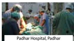
Padhar Hospital, Padhar