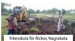
Yrkesskola för flickor, Nagrakata