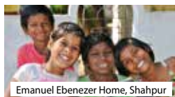
Emanuel Ebenezer Home, Shahpur