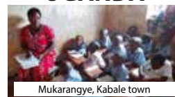
Mukaranye, Kabale town