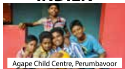
Agape Child Centre, Perumbavoor