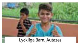
Lyckliga Barn, Autazes