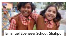
Emanuel Ebenezer School, Shahpur