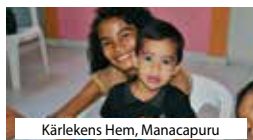
Kärlekens Hem, Manacapuru