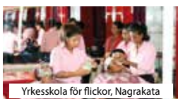
Yrkesskola för flickor, Nagrakata