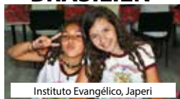
Instituto Evangélico, Japeri