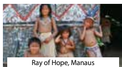
Ray of Hope, Manaus