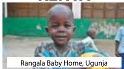
Rangala Baby Home, Ugunja