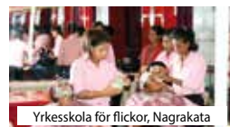
Yrskeskola för flickor, Nagrakata