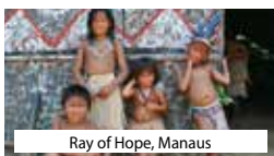
Ray of Hope, Manaus