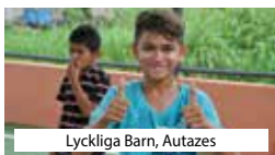
Lyckliga Barn, Autazes