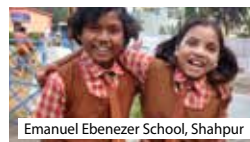
Emanuel Ebenezer School, Shahpur