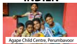
Agape Child Centre, Perumbavoor