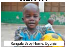
Rangala Baby Home, Ugunja