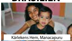
Kärlakens Hem, Manacapuru