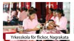
Yrskeskola för flickor, Nagrakata