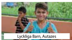
Lyckliga Barn, Autazes