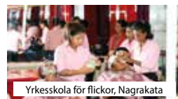
Yrskeskola för flickor, Nagrakata