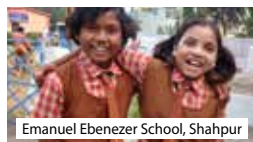
Emanuel Ebenezer School, Shahpur