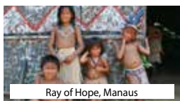
Ray of Hope, Manaus