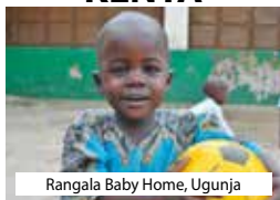
Rangala Baby Home, Ugunja