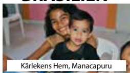
Kärlakens Hem, Manacapuru