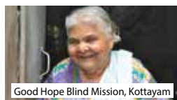
Good Hope Blind Mission, Kottayam