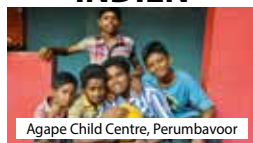
Agape Child Centre, Perumbavoor