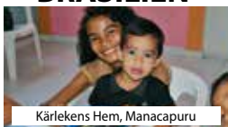
Kärlakens Hem, Manacapuru