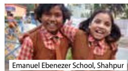
Emanuel Ebenezer School, Shahpur