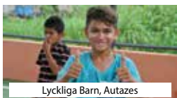
Lyckliga Barn, Autazes