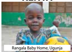
Rangala Baby Home, Ugunja