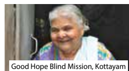
Good Hope Blind Mission, Kottayam