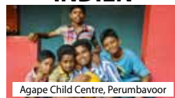
Agape Child Centre, Perumbavoor