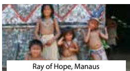
Ray of Hope, Manaus