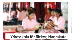
Yrskeskola för flickor, Nagrakata